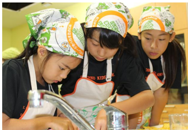
どろんこキッズスクールの様子

次世代を担う子どもたちに「食」と「農」の大切さを伝えたい—そんな思いから、ベジキッチンでは様々な体験教室を開催しています。