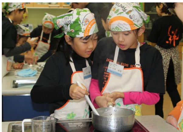
どろんこキッズスクールの様子

次世代を担う子どもたちに「食」と「農」の大切さを伝えたい—そんな思いから、ベジきっちゃんでは様々な体験教室を開催しています。